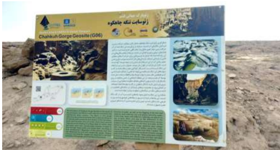
شکل ۱۱: تابلوی تفسیر میراث زمین‌شناختی، ژئوپارک قشم، ایران (۶۵). Figure 11: Interpretation board of geoheritage, Qeshm Geopark, Iran (65).

نه تنها جذابیت دیداری مناظر را افزایش می‌دهد، بلکه با روایت تاریخ زمین‌شناسی منطقه و تقویت حس مکان، تجربه‌ای عمیق‌تر و معنادارتر را برای گردشگران فراهم می‌کند. در بُعد زیبایی‌شناسی، تنوع و تباین رنگ‌ها به‌طور چشمگیری بر ادراک زیبایی مناظر زمین‌شناختی و جذابیت آن‌ها تأثیرگذار است و می‌تواند میزان استقبال و توجه گردشگران را افزایش دهد. از سوی دیگر، رنگ به عنوان یک ابزار حیاتی برای حفاظت میراث زمین‌شناختی، در ارزیابی وضعیت حفاظت و شناسایی تخریب‌های ناشی از تغییرات محیطی به کار می‌رود و به متخصصان کمک می‌کند که با پایش تغییرات رنگ، راهبردهای حفاظتی مؤثرتری را برای این میراث تدوین کنند. افزون بر این، رنگ‌ها با تأثیر بر احساسات و ایجاد حس تعلق، نقشی کلیدی در شکل‌گیری حس مکان ایفا می‌کنند. این امر می‌تواند موجب تقویت ارتباط عاطفی بازدیدکنندگان با مناظر و تشویق آن‌ها به حمایت از حفاظت این مناطق شود. در نهایت، رنگ به عنوان یک ابزار آموزشی و تفسیری عمل کرده و درک بازدیدکنندگان از فرآیندها و تاریخ زمین‌شناختی را تسهیل می‌کند. این کارکردها نشان می‌دهند که توجه به ابعاد رنگ در میراث زمین‌شناختی مقصدهای زمین‌گردشگری نه تنها به غنای تجربه بازدیدکنندگان می‌افزاید بلکه با تأثیرات مثبت بر حفاظت و پایداری، به تحقق اهداف گردشگری پایدار نیز کمک می‌کند.