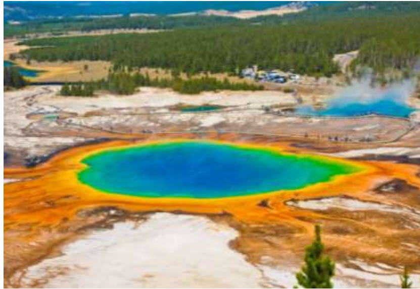
شکل ۲: چشمه منشوری بزرگ، پارک ملی یلواستون، آمریکا (۳۲).