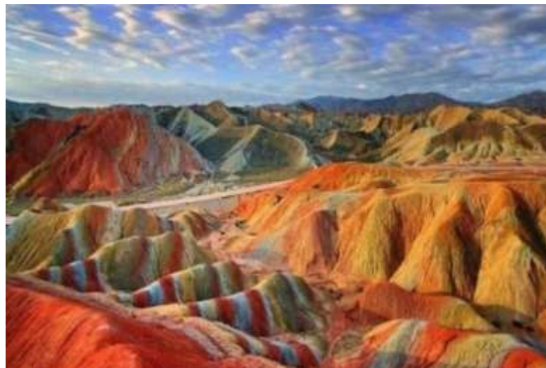
شکل ۱: کوه‌های رنگی ماهنشان، استان زنجان، ایران (۳۱).

رنگ به‌عنوان یکی از اساسی‌ترین عناصر زیبایی‌شناسی (۲۷)، نقشی کلیدی در ارزش‌گذاری میراث زمین‌شناختی ایفا می‌کند. پژوهش‌های متعدد در این زمینه تأیید می‌کنند که تباین و تنوع رنگ‌ها در مناظر زمین‌شناختی، به‌طور مستقیم بر جذابیت دیداری و درک زیبایی آن‌ها اثر می‌گذارد. روبن ۱ و همکارانش ارزیابی رنگ در مطالعات میراث زمین‌شناختی را در چهار روش معرفی نموده‌اند: (۱) شناسایی رنگ‌های اشکال زمین‌شناختی منحصر به فرد؛ (۲) محاسبه تعداد رنگ اشکال زمین‌شناختی؛ (۳) ارزیابی کنتراست رنگ‌ها در میراث زمین‌شناختی؛ (۴) مقایسه رنگ اشکال زمین‌شناختی با توجه به رنگ بافت منظر (۲۸). در این راستا، پرالونگ ۲ (۲۹) با دسته‌بندی ارزش‌های میراث زمین‌شناختی به چهار گروه زیبایی‌شناسی، علمی، فرهنگی و اقتصادی، تباین رنگ‌ها را یکی از مهم‌ترین شاخص‌های زیبایی‌شناختی معرفی کرده است. او اشاره می‌کند که مناظری با رنگ‌های مشابه، کم‌ترین امتیاز زیبایی‌شناختی را دریافت می‌کنند، در حالی که تنوع رنگ‌ها امتیاز متوسط و تباین رنگ‌ها بالاترین امتیاز را به همراه دارند. این تباین، با ایجاد جلوه‌های دیداری متنوع و پویا، تجربه دیداری غنی‌تری به مخاطب ارائه می‌دهد. در تأیید این دیدگاه، رینارد ۳ و همکارانش (۳۰) نیز بر اهمیت تباین رنگ‌ها در افزایش جذابیت مناظر زمین‌شناختی تأکید می‌کند و اذعان دارد که چشم‌اندازهایی با تباین بالای رنگ‌ها معمولاً در زمره مکان‌های زیباتر و جذاب‌تر قرار می‌گیرند. این تباین، مناظر را از نظر دیداری پیچیده‌تر و پرجاذبه‌تر می‌کند، که نتیجه آن جذب گردشگران و علاقه‌مندان به طبیعت و زمین‌شناسی است. شکل‌های ۱ تا ۳ نمونه‌هایی از تاثیرگذاری رنگ در زیبایی‌شناسی میراث زمین‌شناختی را نشان می‌دهد.