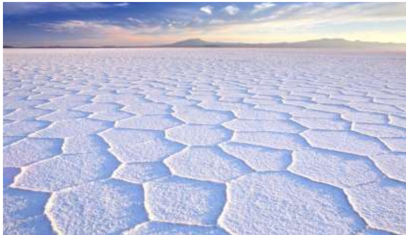
شکل ۴: کویر نمک سالار دِ اویونی، بولیوی (۴۱). Figure 4: Salar De Uyuni Salt Flat, Bolivia (41).