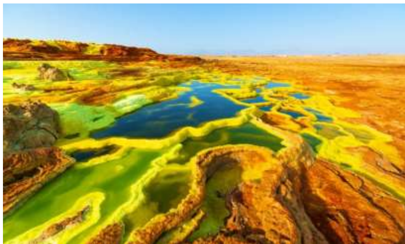
شکل ۵: چشمه‌های آب گرم دالول، منطقه عفر، اتیوپی (۴۲). Figure 5: Dallol Hot Springs, Afar Region, Ethiopia (42).