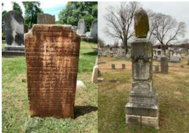
شکل ۸: منطقه تاریخی مونت اولیو، کارولینای شمالی، آمریکا (۵۰). Figure 8: Mount Olive, North Carolina, USA (50).

فرآیندهای تجزیه مانند افزایش حلالیت کربنات‌ها در حضور نیتریک اسید و ایجاد تخلخل در سطح سنگ‌ها نیز باعث تسریع تخریب