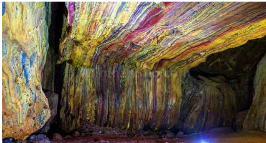
شکل ۳: غار رنگین‌کمان، جزیره هرمز، ایران (۳۳).