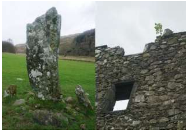
شکل ۷: سنگ‌های ایستاده لارگی و قلعه کیلچورن، اسکاتلند، بریتانیا (۴۹). Figure 7: Largie Standing Stones and Kilchurn Castle, Scotland, UK(49).

آلاینده‌هایی نظیر دی‌اکسید کربن و دی‌اکسید گوگرد باعث تغییرات شیمیایی در سطح سنگ‌ها می‌شوند که منجر به تغییرات رنگ و ایجاد الگوهای تخریبی مختلف می‌گردد. به‌عنوان مثال، واکنش دی‌اکسید گوگرد با کربنات کلسیم موجب تشکیل گچ و ایجاد پوسته‌های سیاه در بخش‌های محافظت‌شده و نواحی سفید در سطوح شسته‌شده توسط باران می‌شود. این تغییرات رنگ به متخصصان این امکان را می‌دهد که مکان‌های آسیب‌دیده را شناسایی و اقدامات لازم برای حفاظت از سنگ‌ها را انجام دهند (۴۸). شکل‌های ۷ و ۸ نمونه‌ای از تغییر رنگ میراث سنگی در اثر عوامل محیطی و آلودگی را نشان می‌دهد.