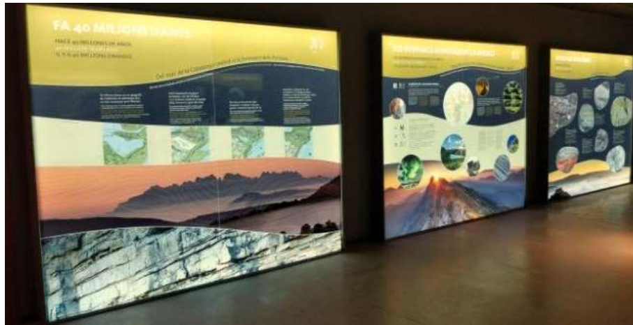
شکل ۹: تابلوی تفسیر میراث زمین‌شناختی، ژئوپارک کاتالونیا، اسپانیا (۶۳).

زمین‌شناختی منطقه ارتباط برقرار کنند. در این خصوص، زمین‌گردشگری نیز بر اهمیت عناصر زمین‌شناختی، از جمله رنگ، برای درک بهتر فرایندهای تشکیل‌دهنده مناظر تاکید دارد (۶۱). ادغام رنگ در ابزارهای تفسیر میراث زمین‌شناختی، مانند تابلوها و راهنماها، مفاهیم پیچیده زمین‌شناختی را به صورت ساده و قابل فهم به نمایش می‌گذارد و دسترسی عموم به این اطلاعات تخصصی را آسان‌تر می‌کند. علاوه بر این، کدگذاری رنگی در نقشه‌های زمین‌شناسی و تابلوهای