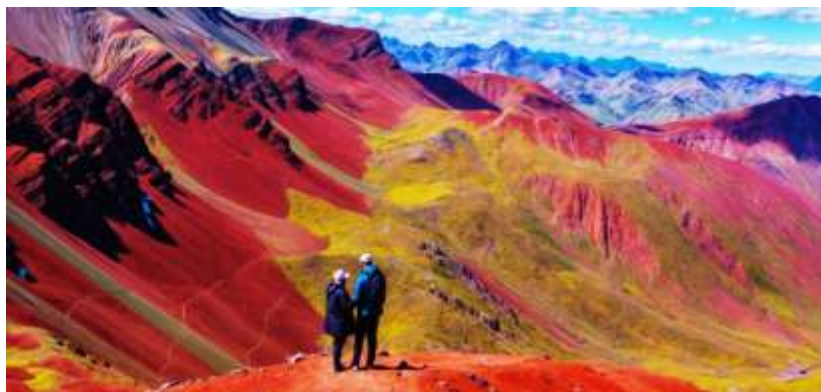
شکل ۶: دره سرخ، استان کانچیس، پرو (۴۳). Figure 6: Red Valley, Province of Canchis, Peru (43).